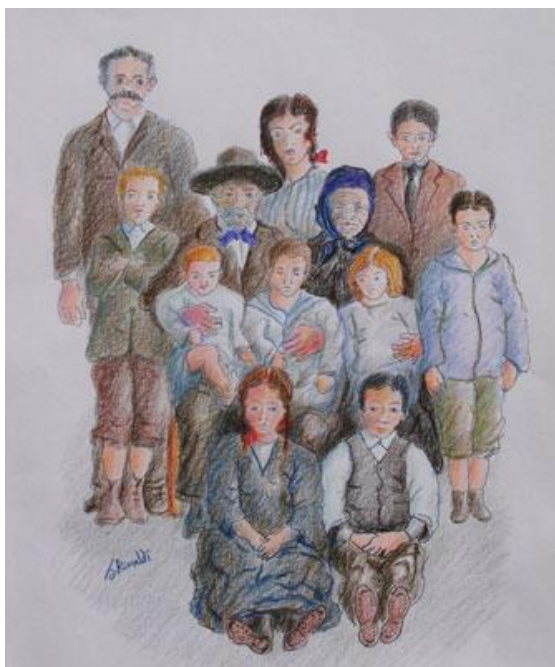
Disegno di G. Rinaldi